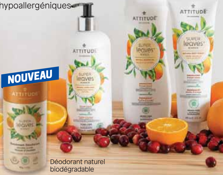
Déodorant naturel biodégradable

20% OFF REGULAR PRICE DE RÉDUCTION SUR LE PRIX RÉGULIER