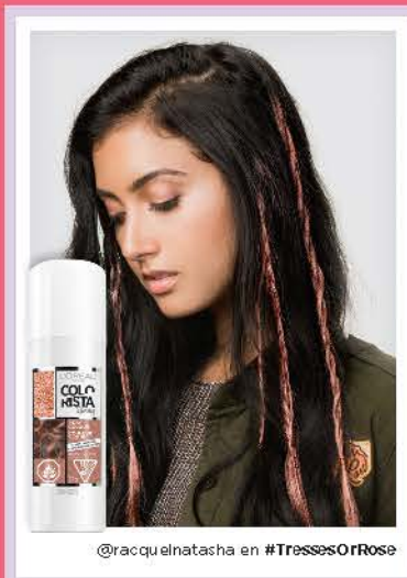
@racquelnatasha en #TressesORose